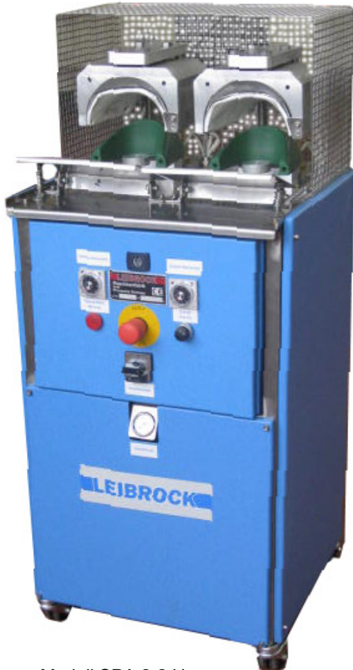
Modell SPA 2-2 H

Typ SPA 2-1 einstellig mit Wasserdampf Typ SPA 2-1 H einstellig mit Hochdruckdampf Typ SPA 2-2 zweistellig mit Wasserdampf Typ SPA 2-2 H zweistellig mit Hochdruckdampf