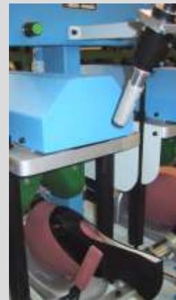
Lampa projekcyjna do wyznaczania ułożenia cholewki