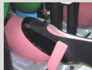
Chwytnicze gotowych cholewek Tong unit for finished uppers