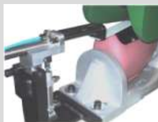
Chwytnicz do małych elementów Tong unit for small parts